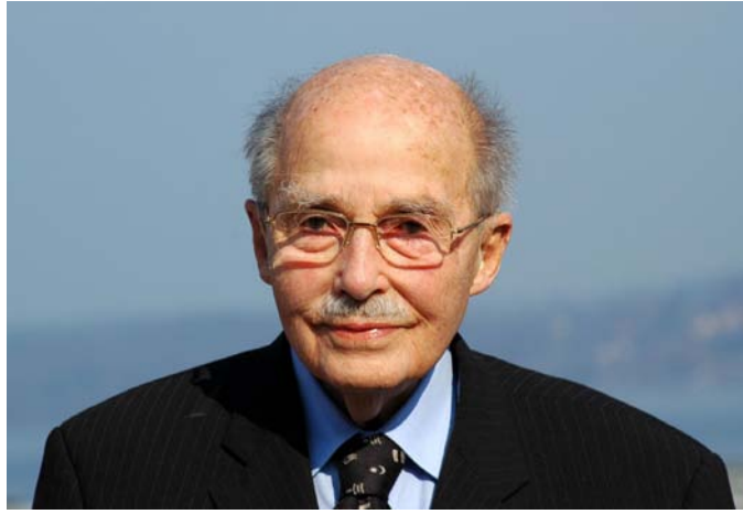
Otto von Habsburg

Als die Nachricht vom Tod Ottos von Habsburgs bekannt wurde, stellten viele Journalisten fest, dass eine Ära zu Ende gegangen sei. Vor allen Dingen hatten sie dabei im Blick, dass Otto von Habsburg (* am 20. November 1912 in Reichenau) als Erzherzog Otto seit 1916 der Kronprinz von Österreich-Ungarn gewesen war. Wäre nicht die Doppelmonarchie am Ende des Ersten Weltkrieges 1918 aufgelöst worden, was 1919 zur Enteignung und zum Landesverweis der Familie der Habsburger und einer Emigration der kaiserlichen Familie in die Schweiz führte, dann wäre Otto von Habsburg seinem Vater Karl I. von Österreich († 1. April 1922) wohl als König von Österreich, Ungarn, Böhmen und Kroatien nachgefolgt.