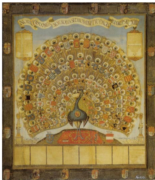
Eine lange Tradition: Der Habsburger Pfau mit den Wappen der Herrschaften des Hauses Habsburg 1555.

In der Aeneis des Vergil ist nicht bekannt, wie Aeneas die Einigung Italiens erlebte. Vergil lässt sein Epos mit dem Tötungsdelikt seines Helden an Turnus, seinen Gegenspieler, ausklingen – ein dunkler Schatten in der vom Fatum bestimmten Biographie des Aeneas. Und Otto von Habsburg? Er hat den Osten Europas stürzen