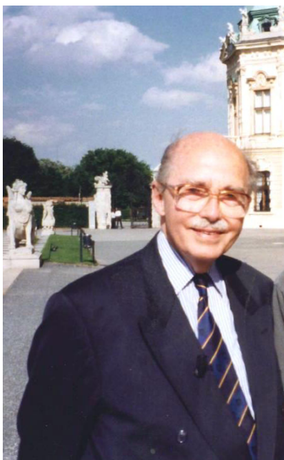
Otto von Habsburg-Lothringen, bei einem Interview am Belvedere Palast/Wien 1998

der allerdings zufällig gerade noch rechtzeitig ein Jahr zuvor die für eine CSU-Kandidatur nötige deutsche Staatsbürgerschaft beantragt hatte. Im außenpolitischen Ausschuss tätig, arbeitete er an der gemeinsamen europäischen Außen- und Sicherheitspolitik und an einer Öffnung für den Beitritt der Staaten Mittel- und Osteuropas zur Europäischen Union. Eine einzigartige Bestätigung seiner Ausrichtung nach Osten dürfte die Flucht von 661 Deutschen aus der DDR gewesen sein, die am 19. August 1989 in Sopron an der österreichisch-ungarischen Grenze beim sogenannten Paneuropäischen Picknick, einer Friedensdemonstration, während einer symbolischen Öffnung eines Grenztors in den Westen flüchteten. Otto von Habsburg war Mitinitiator und Schirmherr dieses Picknicks, das in der Folge vielen Menschen jenseits des ehemaligen Eisernen Vorhanges die Freiheit bringen sollte. Auch nach seinem Ausscheiden aus dem Europäischen Parlament im Jahre 1999 war Otto von Habsburg als Redner und Berater mittel- und osteuropäischer Regierungen tätig – bis am 3. Februar 2010 seine Frau Regina, Prinzessin von Sachsen-Meiningen, starb. Otto, der Ururenkel Franz II., des letzten Kaisers des Heiligen Römischen Reiches Deutscher Nation, bzw. der Ururururenkel Maria Theresias, folgte seiner Gemahlin, der Mutter von sieben Kindern, wenige Monate später im hohen Alter von 98 Jahren am 4. Juli 2011.