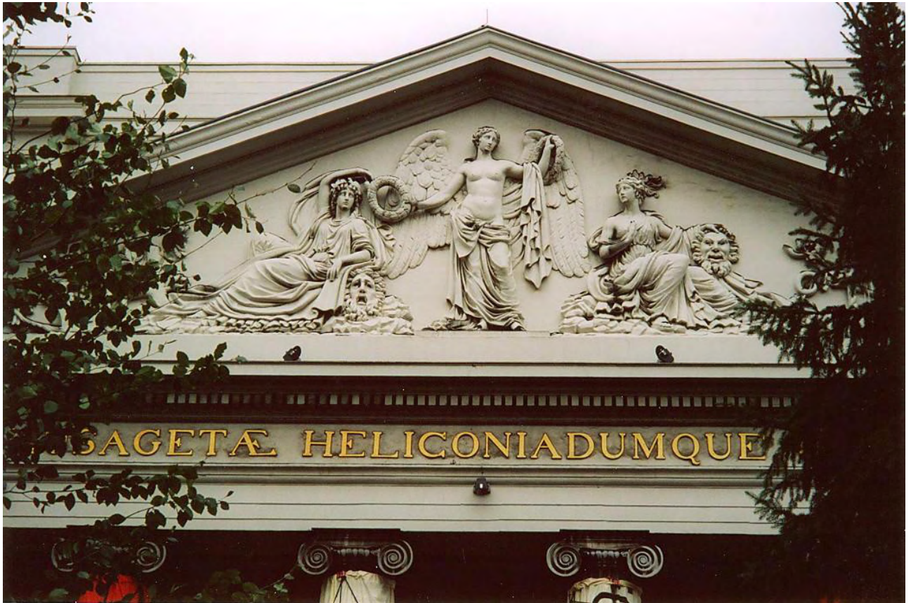
Musagetae Heliconiadumque choro - rätselhafte Inschrift am Aachener Stadttheater. (2005 waren zeitweise Bäume vor dem Theater aufgepflanzt).