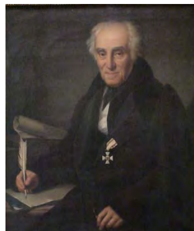
Ferdinand Franz Wallraf, 1824 gemalt von Egidius Mengelberg, Wallraf-Richartz-Museum