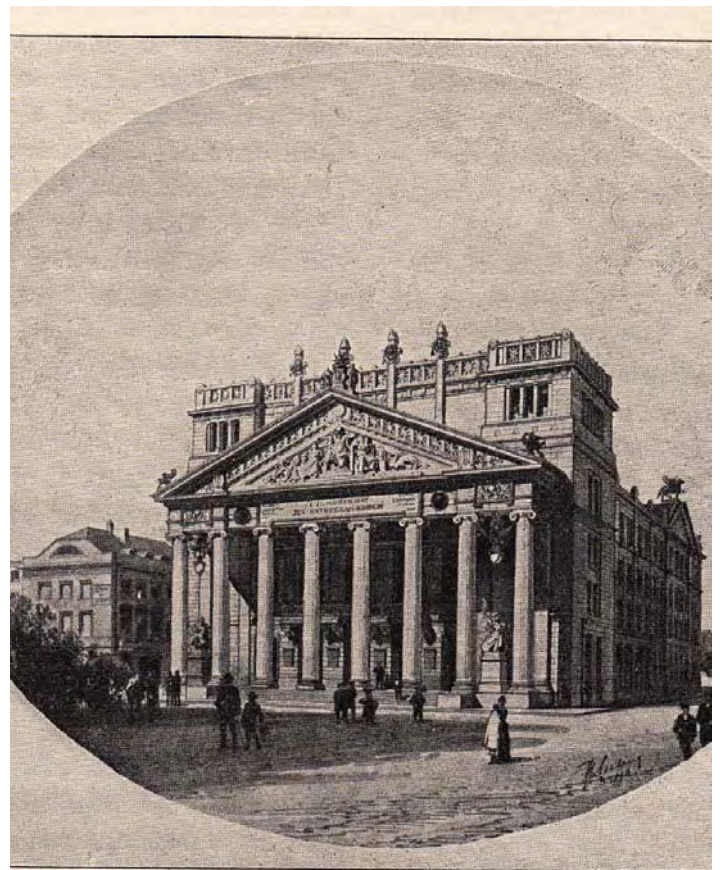
H. Seeling. Das Stadttheater in Aachen nach dem Umbau