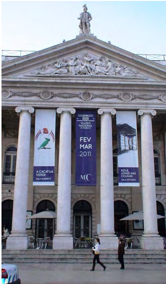
Nationaltheater in Lissabon eingeweiht 1864 Näheres in PLL 15

20 Natürlich ist auch die Darstellung des Apollo – oder eines Genius – auf dem Giebelfeld eine Besprechung wert, die sich im Zusammenhang mit einer Vorstellung der entsprechenden Metamorphose Ovids über Apollo und Daphne in einer der nächsten Ausgaben der PLL anbietet. Auch hier fällt eine Vorlage Wallrafs ins Auge, der für Bonapartes Besuch in Köln einen Als Apollo verkleideten Schüler von einem Tisch herabsteigen und Bonaparte einen Lorbeerkranz überreichen ließ.