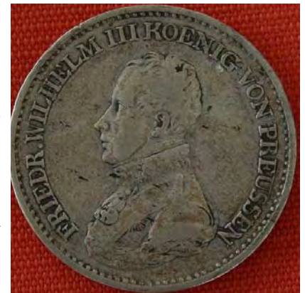
Friedrich Wilhelm III. auf einem Taler von 1819

Sehr bald folgte die nächste Gelegenheit, Friedrich Wilhelm zu ehren. Am 16. November 1822 stand die Feier des 25-jährigen Thronjubiläums des preußischen Königs an, ein Nationalfest, das in Aachen mit Glanz und Gloria gefeiert wurde. Nach der Hauptfeier, die u.a. aus einem Dankgottesdienst im Dom, einem Gastmahl für die Invaliden in der Marienthaler Kaserne und die Armen in den Hospizen bestand, folgte die Grundsteinlegung für den Elisenbrunnen am Friedrich-Wilhelm-Platz und nur wenige Meter entfernt für ein neues Schauspielhaus. Allein für die Anlage des Brunnens hatte die preußische Regierung einen Zuschuss von 10.000 Talern bewilligt. 4 Am Abend wurde ein Benefizkonzert gegeben, gefolgt von einem Feuerwerk und einer Illumination des Rathauses und anderer öffentlicher Gebäude. Dabei konnte der König weitere Inschriften bewundern, z. B. vor dem damaligen Burtscheider Casino: