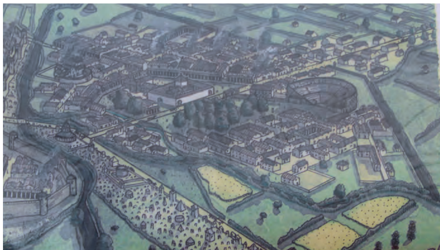
Sah so das Viertel Genetoye in augusteischer Zeit aus? Im Mittelpunkt befindet sich der gallo-römische Umgangstempel, rechts daneben ein Theater. Detail aus einem Blatt, das die Führerin mitgebracht hatte.

worden zu sein, dessen Überreste heute noch zu sehen sind. Weitere Gebäude standen in nächster Nähe. Diese Tempelanlage wurde etwa 250 Jahre besucht. Man liest von einem sogenannten Janustempel, aber mit dem römischen Gott hat der Tempel gar nichts zu tun, er ist aus der Bezeichnung temple de Genetoye entstanden. Mächtig sind auch noch die Ruinen, allein die noch erhaltene Höhe der steinernen Cella, die den hölzernen Vorgänger der Kelten abgelöst hat, bemisst sich auf 24 Meter bei 2,2 m Dicke, die Seitenlänge des fast quadratischen Turms beträgt etwas über