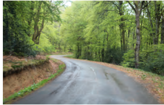
Am Fuße des Mont Beuvray auf dem Weg nach Bibracte

Deshalb haben sie, nachdem in Noviodunum die Wächter und die Menschen, die wegen des Handels