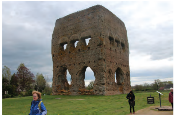
Auch die Ruinen des gallo-römischen Umgangstempels beeindrucken noch.

Die Führung durch das antike Autun wartete zunächst mit einer Überraschung auf. Der Treffpunkt war einige hundert Meter vor der Stadt Autun. Hier befindet sich am Zusammenfluss von Arroux und Ternin der Ortsteil La Genetoye (d.h. wo der Ginster sprießt) auf einer Fläche von 45 Hektar. Auf diesem Gelände fanden Archäologen neben dem Tempel noch ein Handwerker-viertel, eine Nekropole und mittels Luftbildaufnahmen in wenigen hundert Metern Entfernung sogar ein Theater, das von 2014 bis 2016 teilweise ausgegraben wurde. Mit rund 200 ha, etwa so groß wie Bibracte, ist dieses Gesamtgelände mit dem Tempel und dem römischen