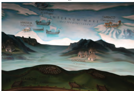
Sicht von Alesia nach Süden

Mit großer Spannung betraten wir das Museum, den Muséoparc Alésia, der sich die didaktische Umsetzung der Ereignisse von 52 v. Chr. zum Ziel gesetzt hat. Wer aber zunächst noch einen Blick in das Außengelände nimmt, erhält eine Vorstellung von den gewaltigen Befestigungswerken der Römer. Ein Entkommen der ausgehungerten Gallier war nicht möglich. Überall Wachttürme und Fallen – eine Maueranlage, die an die schlimmen Zeiten der Mauer der DDR erinnerte. Sogar experimentelle Archäologie wird hier betrieben. Anschaulich erfährt der Besucher, was die Kelten mit ihren Öfen herstellen konnten. Aber der eigentliche Höhepunkt wartet im Museum. Schon beim Betreten der Ausstellung wird der Besucher in das Kriegsgeschehen versetzt. Ohrenbetäubend sind die sogenannten carnices , mit denen die Kelten ihre Gegner einschüchtern wollten. Sie erinnerten uns an die Vuvuzela, das „Musik“-instrument der Südafrikaner während ihrer Fußballweltmeisterschaft im Jahre 2010. Wer durch die Provence mit aufmerksamen Augen fährt, entdeckt diese Carnyx mehrfach wieder,