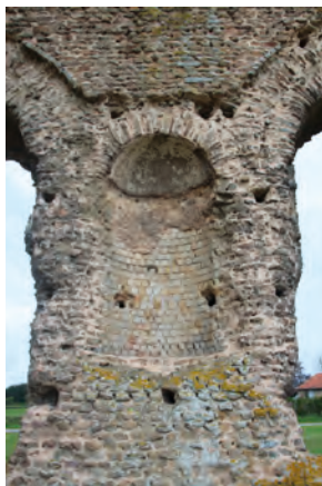
Welche Gottheit wurde in dieser Nische verehrt?

Theater eines der größten gallorömischen Ansiedlungen im gesamten Gebiet Galliens. Aber trotz aller Forschungen im letzten Jahrzehnt ist dieser Vorort Autuns immer noch rätselhaft.