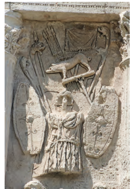
Tropaion auf dem Ehrenbogen von Orange mit Signum (Wildschwein) und Carnices

z.B. an dem Ehrenbogen von Orange. Didaktisch ist dieses