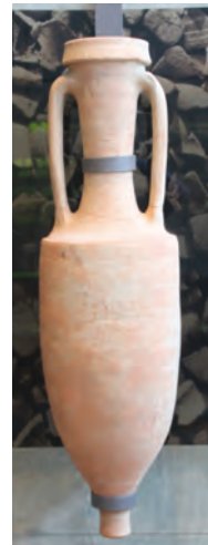
Weinamphoren vom Typ Dressel 1a zeugen von Weinhandel schon im 2. Jhd. v. Chr. zwischen Italien und Gallien.