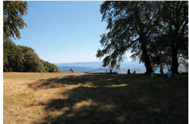
Das keltische Belleme: Genug Platz für eine Versammlungsstätte des gallischen Landtages und eine phänomenale Aussicht nach Südwesten auf das Land der Arverner

Als man sich nicht einig wird, wird ein Landtag nach Bibracte einberufen: Re in controversiam deducta totius Galliae concilium Bibracte indicitur ( Bell. Gall. 7,63,5). Der Leser gewinnt immer mehr den Eindruck, dass sich hier inzwischen die Keimzelle der antirömischen Aktionen befindet. Allerdings können die Häduer ihren Wunsch nicht durchsetzen, Vercingetorix wird in seinem Gastspiel in Bibracte der Oberbefehl übertragen. Ein letztes Mal erwähnt Caesar Bibracte an exponierter Stelle. Nach dem Sieg der Römer über die vereinten keltischen Stämme beschließt Caesar, höchstpersönlich in Bibracte zu überwintern: Ipse Bibracte hiemare constituit ( Bell. Gall. 7,90,7). Ein deutliches Zeichen dafür, dass die Römer die Herren des Landes bleiben. Hier entsteht