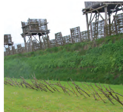
In den Außenanlagen des Museums von Alesia

Rechtfertigung im Winter 52/51 in Bibracte das Bellum Gallicum , das lange die einzige Quelle war; schriftliche Zeugnisse von Seiten der Gallier gab es so gut wie keine. Doch seit dem 19. Jahrhundert legte die moderne Archäologie ihrerseits Spuren frei. Münzen, Rüstungen, Pferdeskelette, vor allem aber die römischen Befestigungsgräben – die Beweislast ist erdrückend. Heute weiß man, dass die Ereignisse sich im heutigen Alise-Sainte-Reine ereignet haben. Das siebte Buch des gallischen Krieges ist sehr, sehr umfangreich und enthält zu großen Teilen die Ereignisse von Alesia. Caesar hatte zwei Befestigungslinien