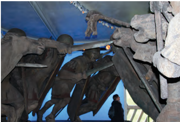
Links Römer, rechts Gallier

mit mehr als zwanzig Lagern erbaut, eine Linie, um die Belagerten im Oppidum nicht entkommen zu lassen, eine zweite Linie, um sich gegen den zu erwartenden Angriff von außen zu schützen. Tatsächlich gingen nach einem Monat die Lebensmittel aus, was zu dramatischen Szenen im Oppidum führte bis hin zum Vorschlag von Kannibalismus. Endlich kommt auch die erwartete Hilfsarmee, doch die 240.000 Infanteristen und 8.000 Reiter ziehen letztlich den Kürzeren. Mit der Auslieferung des Vercingetorix ist nach eineinhalb bis zwei Monaten die Freiheit Galliens endgültig Vergangenheit. Es beginnt die gallorömische Epoche, in der die keltische Kultur mit der römischen verschmilzt mit Konsequenzen für Verwaltung, Religion, Architektur und Sprache. Diese Verschmelzung statt Vernichtung zeigt sich schon in Alesia: Das Oppidum Alesia erhält im ersten Jahrhundert n. Chr. ein 5.000 Zuschauer fassendes Theater, ferner einen römischen Tempel, eine Basilica als administratives Zentrum, natürlich auch ein Forum als Mittelpunkt und Wohn- und Arbeitsquartiere der Handwerker.