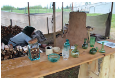
Experimentelle Archäologie in den Außenanlagen