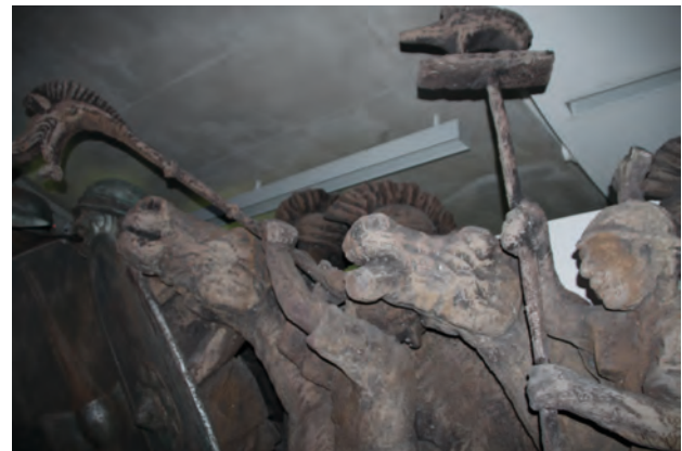
Gallier mit Carnyx und Signum (Wildschwein).

Mit großer Spannung betraten wir das Museum, den Muséoparc Alésia, der sich die didaktische Umsetzung der Ereignisse von 52 v. Chr. zum Ziel gesetzt hat. Wer aber zunächst noch einen Blick in das Außengelände nimmt, erhält eine Vorstellung von den gewaltigen Befestigungswerken der Römer. Ein Entkommen der ausgehungerten Gallier war nicht möglich. Überall Wachttürme und Fallen – eine Maueranlage, die an die schlimmen Zeiten der Mauer der DDR erinnerte. Sogar experimentelle Archäologie wird hier betrieben. Anschaulich erfährt der Besucher, was die Kelten mit ihren Öfen herstellen konnten. Aber der eigentliche Höhepunkt wartet im Museum. Schon beim Betreten der Ausstellung wird der Besucher in das Kriegsgeschehen versetzt. Ohrenbetäubend sind die sogenannten carnices , mit denen die Kelten ihre Gegner einschüchtern wollten. Sie erinnerten uns an die Vuvuzela, das „Musik“-instrument der Südafrikaner während ihrer Fußballweltmeisterschaft im Jahre 2010. Wer durch die Provence mit aufmerksamen Augen fährt, entdeckt diese Carnyx mehrfach wieder,