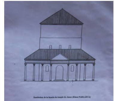
So könnte die Fassade des Tempels ausgesehen haben.

2013 begannen Ausgrabungen in der Nähe des Turms dieses gallorömischen Heiligtums. Die Archäologen konnten Spuren einer Besiedlung aus der Latènezeit, genauer aus der jüngsten vorrömischen Eisenzeit nachweisen und zwar aus der sogenannten Zeit LT D (150–15 v. Chr./0). Dieses kulturelle Zentrum lässt sich allerdings kaum mehr näher bestimmen. Man geht davon aus, dass ein erster Tempel aus Holz mit einem Umgang in den 50er Jahren n. Chr. erbaut worden ist, gegen Ende des ersten Jahrhunderts scheint ein zweiter, größerer Tempel aus Stein errichtet