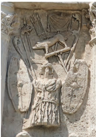
Triumph über nichtrömische Krieger auf dem Ehrenbogen von Orange. Deutlich zu erkennen sind lärmende Carnyces, das Blasinstrument der Kelten mit dem Wildschweinkopf zwischen 300 v. und 200 n. Chr.; doch um welche Völker handelt es sich bei den Besiegten?

Autun auch Ziele der Exkursion werden, doch zuvor ging es nach Arlon.