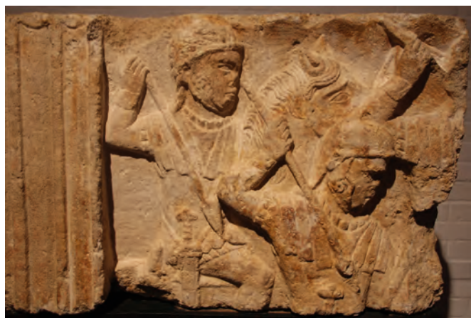
Drei Kavalleristen einer römischen Reiterabteilung. Der Helm des linken Reiters verweist in die Mitte oder erste Hälfte des ersten Jahrhunderts n. Chr.

Beginnen wir mit dem Militär. Das Leben der Gallier änderte sich, als die römischen Legionäre unter Caesar kamen. Wie man sich diesen Moment vorstellen kann, zeigt ein noch gut erhaltenes Relief im Museum: Drei Kavalleristen einer Hilfstuppe ( ala ), gesichert durch einen Brustpanzer, nähern sich auf ihren Pferden mit einer in der rechten Hand erhobenen Lanze. Eine Spatha , ein langes Schwert, hängt vom Wehrgehenk herunter.